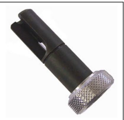
Tubing Entgrater für Edelstahl OD 1/16" - 1/8"