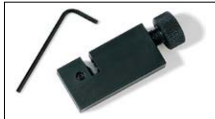
Tubing Cutter für Edelstahl OD 1/4"