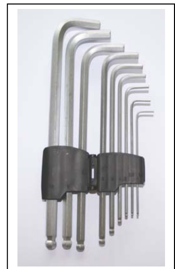
Inbusschlüssel zöllig .050-1/16-5/64-3/32-7/64 1/8-9/64-5/32-3/16-7/32 1/4-5/16-3/8