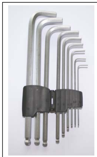
Inbusschlüssel metrisch 1,5-2-2,5-3-4 5-6-8-9-10