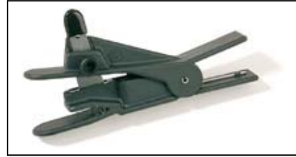
Tubing Cutter für PEEK, PTFE OD 1/16" - 1/8"