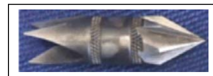
Tubing Entgrater für Edelstahl OD 1/4"