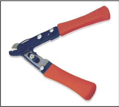
Tubing Cutter für Edelstahl OD 1/16" - 1/8"