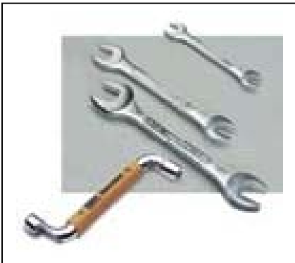
Schlüssel, abgewinkelt, für Rheodyne-Fittings 1/4" + 5/16" und Maulschlüssel 1/4" + 5/16", 3/8" + 7/16" und 1/2" + 9/16"