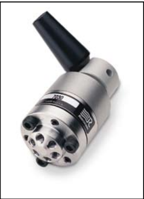
Rheodyne 7030L, Large Bore, Edelstahl Artikel-Nr. 100217