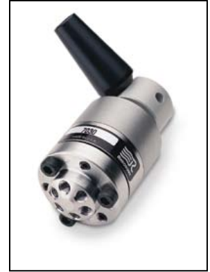
Rheodyne 3030, zum Umschalten, Edelstahl Artikel-Nr. 100100