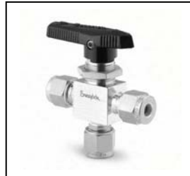
Purge 1/4", Cv 0.35 3 Wege, Edelstahl, Artikel-Nr. 101019