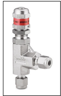
Überdruckventil für Rohr OD1/4", Absperldruck 3,4 - 413 bar, Edelstahl 316