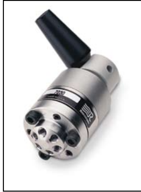
Rheodyne 7725, zur Probenaufnahme, inkl. 20 µl Schleife, Edelstahl Artikel-Nr. 100105