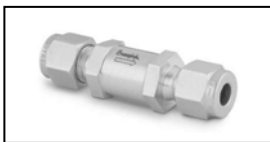
Rückschlagventil für Rohr OD 1/8", Öffnungsdruck 0,69 bar, Edelstahl 316