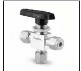
Purge 1/4", Cv 0.90, 3 Wege, Edelstahl, Artikel-Nr. 100993