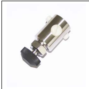
Purge 1/16", Edelstahl Artikel-Nr. 100038